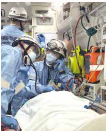
救急活動に従事する救急隊員達

市民の皆様にご協力いただき、救急車に道を譲っていただいたりすることで、速やかな救急活動をすることができており、市民の皆様にはとても感謝しております。