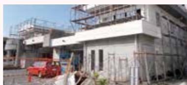
改修中の大沼分署

てきた消防職員としての仕事の延長線上にあると捉えています。チームで1つの目的に向かって仕事をし、同僚達が応援し、協力してくれていますので、女性だからという苦勞を強くは感じていません。