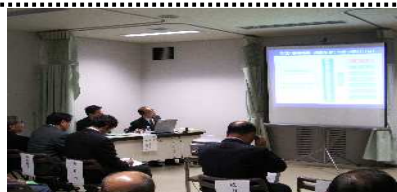
鉄道・運輸機構の説明

有効かつ効率的な活動を行うため、平成17年11月18日に、鉄道建設の専門家である独立行政法人鉄道建設・運輸施設整備支援機構の職員を招いて、延伸の仕組み・事例・活動方法等について講演をいただきました。