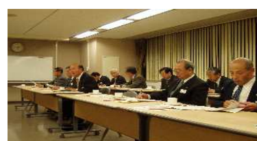
小田急電鉄(株)への要望

相模原市長からは、「延伸の早期実現に向けて努力していきたい」、小田急電鉄からは、「複々線化等に多額の経費を投入しているため、早期の実現は難しいが検討をしていく」とのコメントがありました。