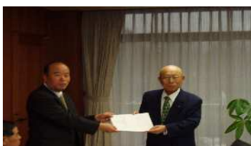
相模原市への要望

平成18年2月1日に、相模原市役所及び小田急電鉄(株)本社を訪問し、延伸の早期実現に関する要望書を手渡すとともに、意見交換を行いました。