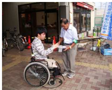
上溝駅前での署名活動

市民大会・・・平成18年1月29日に、相模原駅前公園に約1,200人が集合、大会後はデモ行進を行いました。