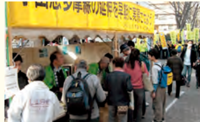
多くの人で賑わう本協議会の展示ブース

当日は、多くの方にニュースを手にしていただいたり、「応援しているから！」と声をかけていただいたり小田急多摩線延伸に向けた本協議会の取り組みについて、理解を示される方が増えてきたと実感しました。