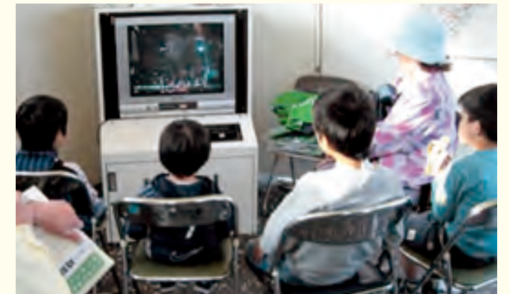
お子様にも大変好評でした！