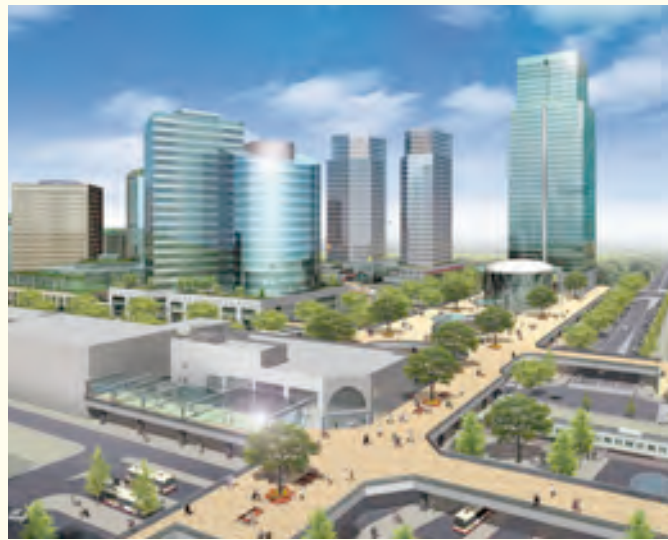
会場となった補給廠返還予定地の開発イメージ

小田急多摩線の延伸は多くの人に期待され関心を持たれている事業であり、今後もこういった機会を捉えてPR活動を継続していきたいと考えております。