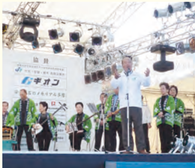
ステージでの「小田急多摩線延伸音頭」お披露目