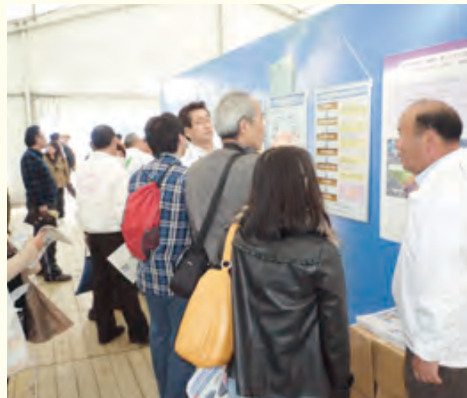
パネルブースも大盛況でした