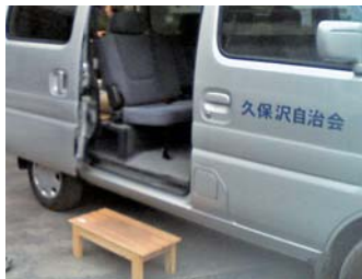
乗りやすいように踏み台も準備

送迎の対象としている方は現在6人おり、八王子医療センター、津久井日赤病院等まで送っています。八王子医療センターは交通の便が悪く、電車とバスを乗り継いでいくと1時間半かかってしまう距離が、車だと15分程度で着きます。ただし迎えについては、帰りの時間が