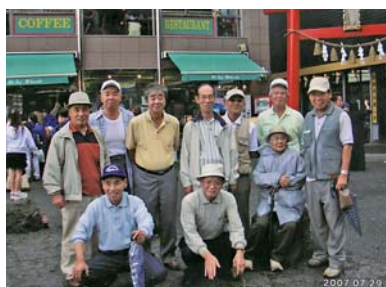
親睦のバス旅行（富士山五合目）