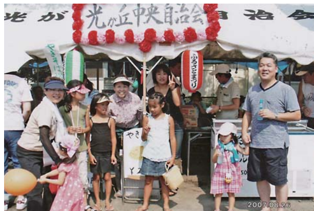
光が丘地区ふるさと祭りの様子