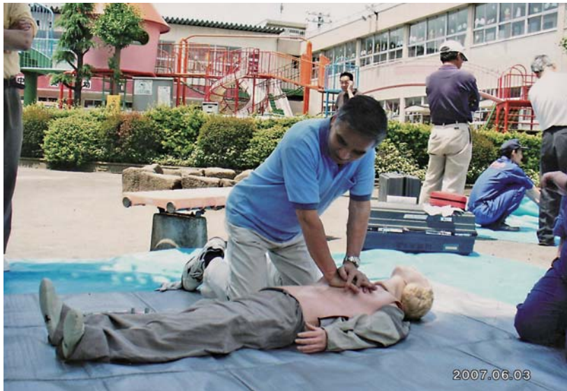
光が丘中央自治会防災訓練