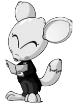
ごみD'E71大作戦 キャラクター レモンちゃん