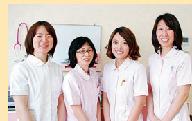
▲スタッフの看護師（左）と保育士の皆さん

薬を飲むのを嫌がる子どもにも、看護師と保育士の知識と経験で対応。落ち着いて座って遊べる工作など、スタッフが工夫した手作りの材料での遊びも好評です。 ※利用には、窓口での登録（無料）が必要です。