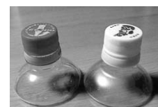
ペットボトルで作った顕微鏡

日にち ○8月17日(金) ペットボトルを利用して簡単な手作り顕微鏡を作ってみよう ○8月18日(土) 家庭から出た食用廃油で石鹸やエコキャンドルを作ってみよう 時間 午前10時～正午 会場 環境情報センター 対象 小学生とその保護者=各15組(申込順) 申し込み 電話で8月16日までに麻溝台環境事業所(☎042-747-1241)へ