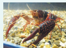
ザリガニにタッチ!

広報事業の財源とするため、広告を掲載しています。広告掲載の申し込みは広聴広報課(☎042-769-8200)へ。掲載した広告のお問い合わせは各広告主へ。