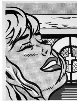
ロイ・リキテンスタイン「船上の少女」1965年 スクリーンプリント © Estate of Roy Lichtenstein, New York & JASPAR, Tokyo,2012

20世紀後半の美術を華やかに彩った、アメリカとヨーロッパの版画約130点を紹介します。 期間 8月4日(土)～9月23日(日) 時間 午前10時～午後5時(土・日曜日、祝日は午後5時30分まで) ※入場は閉館時間の30分前まで 会場 町田市立国際版画美術館(町田市原町田4-28-1) 観覧料 600円(大学生・高校生・65歳以上の人300円、中学生以下の方は無料) ※8月4日は無料 休館日 月曜日(9月17日を除く)、9月18日(火)