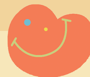
相模原市 認知症サポーター シンボルマーク

若年性認知症は、企業や医療・介護の現場でもまだ認識が不足している現状にあり、社会全体での認知度を高めていく必要があります。