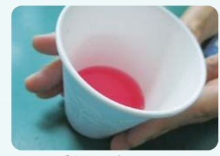
お手製しそジュース!