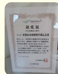
健康経営優良法人 2023取得