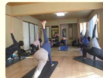
理事長が講師！ピラティス教室（藤野）