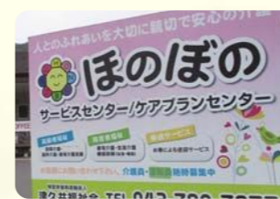
地域の人が利用・交流できる CAFE併設