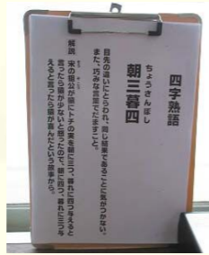
社員へメッセージ