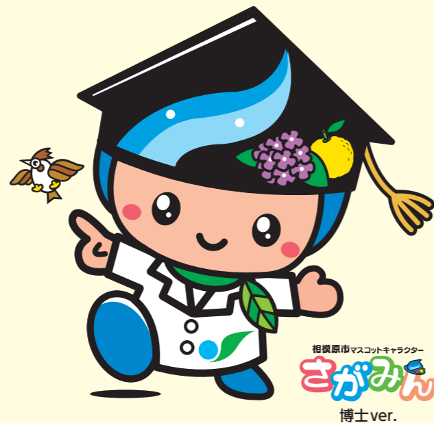
相模原市マスコットキャラクター さがみん 博士 ver.