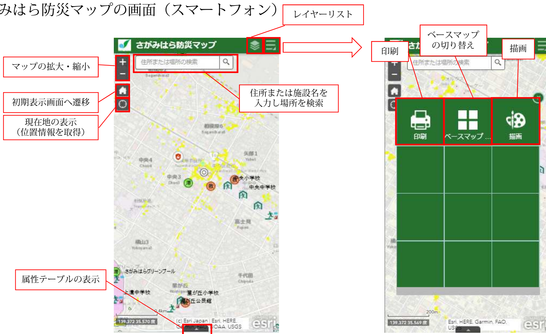
さがみはら防災マップ 使用方法