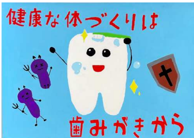
鳥屋学園9年 川口 愛莉