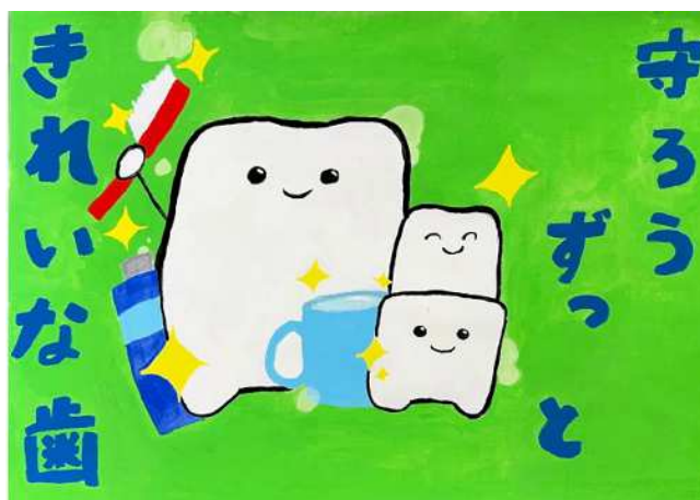
鳥屋学園7年 中村 結