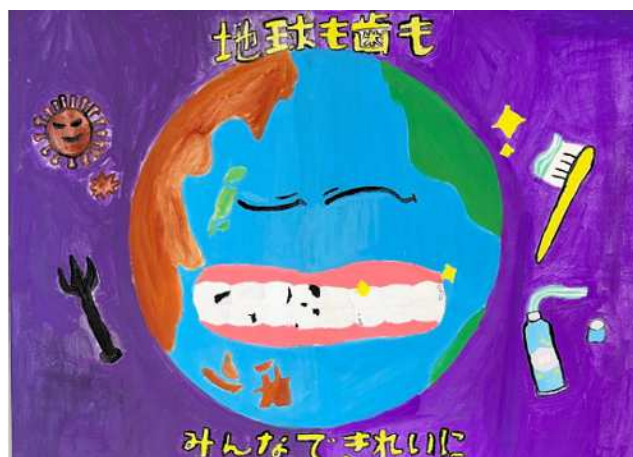
鳥屋学園9年 中山 結芽