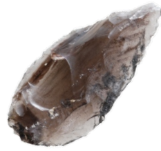
尖頭器とは、主に旧石器時代に使われた狩猟具です。