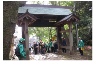
【当麻山無量光寺 山門】

参加者の皆さんからは、「内容が充実」「初めて知ることが多く勉強になった」「地域の関連性が理解できた」などの声と共にたくさんの笑顔もいただき、地域の歴史に親しむことができた有意義な一日となりました。