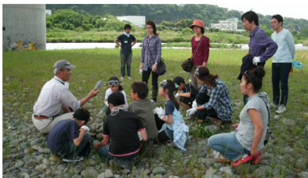
石の選び方や割り方について説明

参加者は、ハテナ館の中で見本の打製石斧を手にとってみたり、石器が主に使われた旧石器時代から縄文時代にかけての生活の様子や、石器製作時の石の選び方や製作方法などについての話を聴いたりしてから、相模川の河原に向