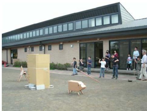
できたばかりの石器で試し投げ

館に戻って仕上げた石器を柄に装着し、麻紐で固定して実際に木を切ったり、ダンボールで作ったシカやイノシシの目標物に当てたりして、完成した喜びを共有することができました。感想会では、「とても楽しかった」、「またチャレンジしたい」などの嬉しい声が聞かれました。