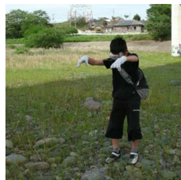
石を落として割る

かいました。河原では危険のないよう、再度安全確認をしてから石器作りの開始です。比較的薄く割れやすい、ホルンフェルスという石の手頃な大きさのものを探し、それをまず上から落として適当な大きさに割ってから、ほかの石で叩いて石器に加工していきました。参加者の中には、初め手頃な石材が見つからなくて困っている人も見られましたが、時間内で全員、無事に完成させることができました。