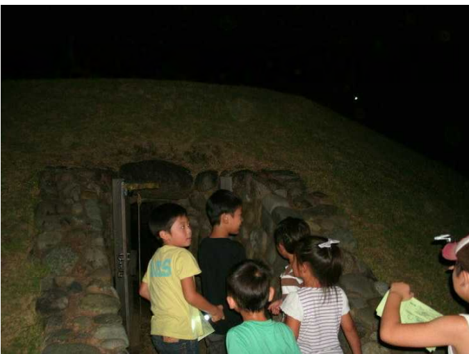
↑古墳の中は真っ暗

8月26日、午後7時から今年も「ナイトミュージアムクイズと肝試し」を開催しました。夜、真っ暗な中でクイズと肝試しを交えながら、田名原遺跡やハテナ館について知ってもらうことをねらいとしています。参加者は受付で整理券兼クイズの解答用紙をもらい、館内に3問、公園に3問設けられたクイズを探しながら、暗闇の中を楽しそうに、また真剣な表情で廻っていました。