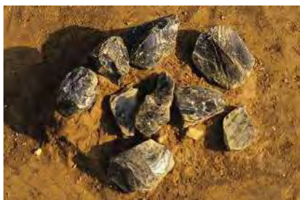
田名塩田遺跡群出土の黒曜石原石9点 ←

原石がまとめて出ること、旧石器時代では希少なことです。今年、市の指定文化財になりましたが、わが国にとって極めて重要な遺物です。