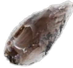
尖頭器とは、主に旧石器時代に使われた狩猟具です。