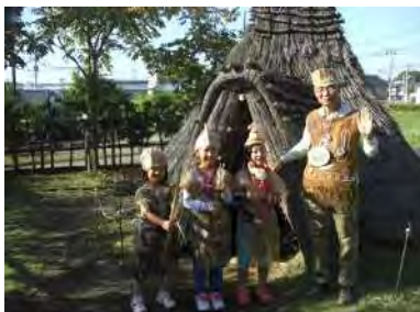
縄文服を着てみよう

今年の旧石器ハテナ館まつりもボランティアや各団体、地域の方々のご協力のおかげで大成功となりました。また来年も楽しいお祭りを企画しますので、ぜひ遊びに来てください。