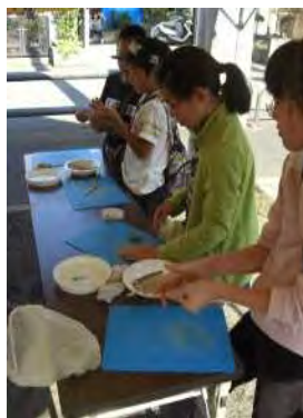
縄文ペンダント作り