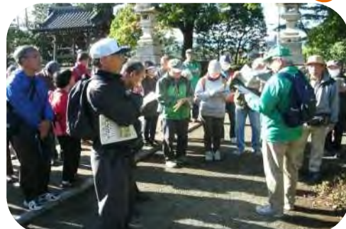
普及員による宝光寺の解説

JR 上溝駅をスタートし、商店街の歩道に埋め込まれた昔の建造物や上溝祭りの絵タイルなどを見ながら、市場開設 50 周年記念碑に到着しました。現在の「まつり通り」では明治から戦前にかけて、毎月 3 と 7 のつく日に市（溝市）が開かれ賑っていました。また隣には相模原市登録有形文化財の芭蕉句碑があります。記念碑から 5 分程の所に武相観音霊場 30 番札所の元町観音堂があり、ここは養蚕や安産にご利益があると言われています。次に鳩川に架かる千年橋と宝光寺（曹洞宗）に向かいました。どちらも石造物が多く、千年橋には「上の不動」と呼ばれる不動明王像が、宝光寺には上溝で初めて種痘を行った「井上篤斎の碑」などがあります。