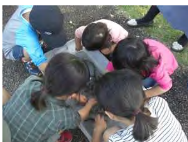
水生生物に触れてみよう