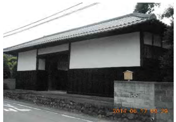
下溝福田家長屋門