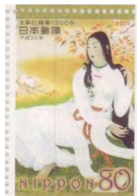
古事記編纂1300年 記念切手 木華開耶媛