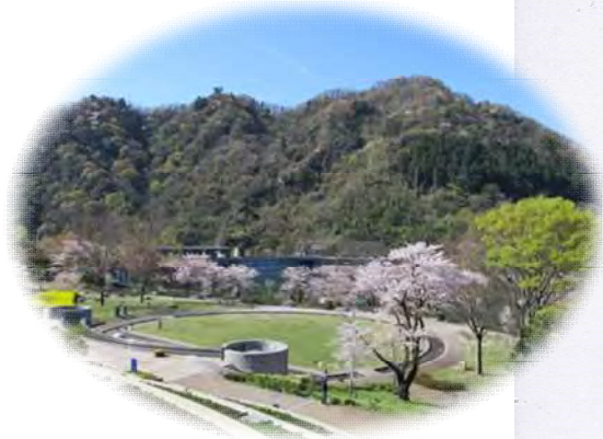
水の苑地から見た城山