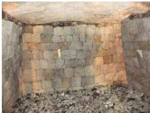
玄室壁面の 互目積み

観音山古墳は高崎市の東部、烏川の支流井野川の右岸台地上に立地する前方後円墳で墳丘は2段築成で、その規模は全長98m、後円部径61m、高さは9.5m、前方部幅63m、高さ9.1m、で墳丘の周囲には馬蹄形を呈する2重の堀があります。この古墳の特徴として 検出された形象埴輪の配列状況は古墳時代の葬送儀礼の一端を具現するものであるとして歴史博物館で保管されています。玄室の壁面は五面加工した人頭大の角閃石安山岩を互目積みし、随所に切り組みの手法が見られるというものでありますが、古墳時代にこのような切り組みの技術があったのかと驚かされました。また、このことを説明されたボランティアガイドの自慢げな様子が印象的でした。