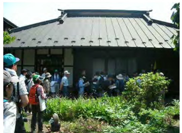
貞心さまと出逢う旅での様子 (福田家母屋)