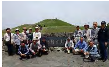
観音山古墳前で記念撮影

富岡製糸場は明治5年(1872)に明治政府が製糸業の近代化を図るために設立した官営模範工場で、木骨煉瓦造りの特色ある建物群が140年以上経った現在もほぼ建築当初のまま保存されています。また当時は日本各地に機械製糸技術を伝えると共に機械製糸場の設立を進め、その生糸はフランスやアメリカに輸出され、明治末期には日本は生糸の生産量、輸出量とも世界一となり世界的な絹の大衆化に貢献しました。本年4月末に世界遺産に登録されることが内定しゴールデンウィークには一日当たりの訪れる人数が以前の5~6倍にもなり盛り上がった様です。それでボランティアガイドもフル回転の忙しさで、今後に備えて現在98名のボランティア希望者を教育中とのことでした。(考古班 光廣)