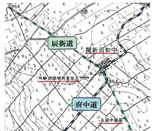
図3 大正10年測図地形図

※本ページの地形図は、国土地理院発行の2万5千分1地形図(原町田)を使用したものです。