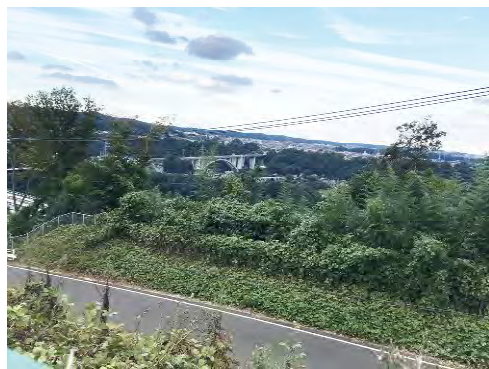
写真1 対岸より遺跡方面を望む