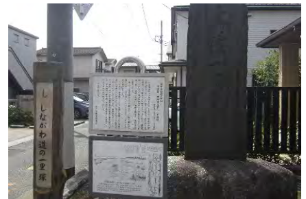
写真4 常久の一里塚