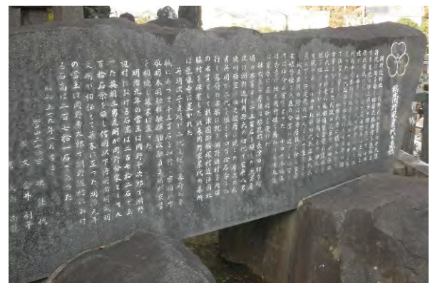
写真7 旗本岡野家累代の墓誌