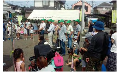
写真3 開会式の様子