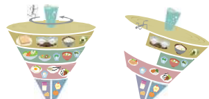
バランスの良い例 バランスの悪い例

食事バランスガイドとは、1日に「何を」「どれだけ」食べたらよいかわかる食事量の目安です。「主食」「副菜」「主菜」「牛乳・乳製品」「果物」の5グループの料理や食品を組み合わせるとるよう、コマに例えてそれぞれの適量をイラストでわかりやすく示しています。