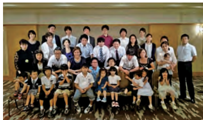
懇親会は家族も一緒に