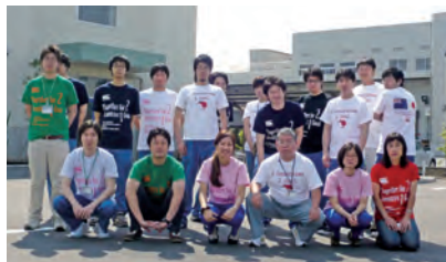
ケミカルTシャツでチーム団結