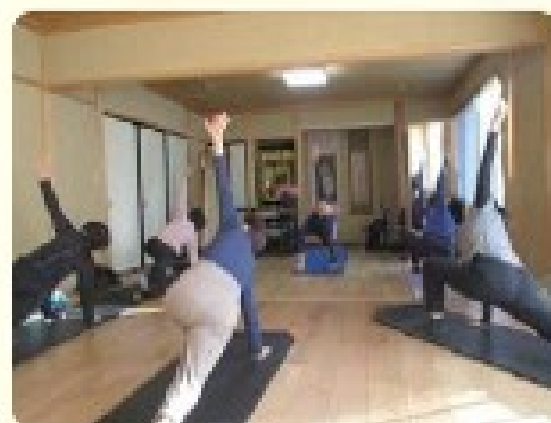
理事長が講師！ピラティス教室（藤野）