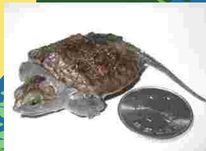
カミツキガメの幼体

河川・湖沼・水路・湿地などに生息。緩やかな流れの止水域の水生植物が多い場所を好む。汽水域にも生息。北米原産。