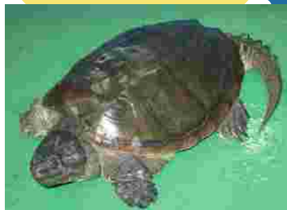
甲羅の色や形は生息環境によって異なります