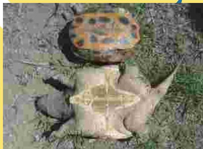
腹側の甲羅は小さく、ひし形 (上：ミシシippiaカミミガメ、 下：カミツキガメ)