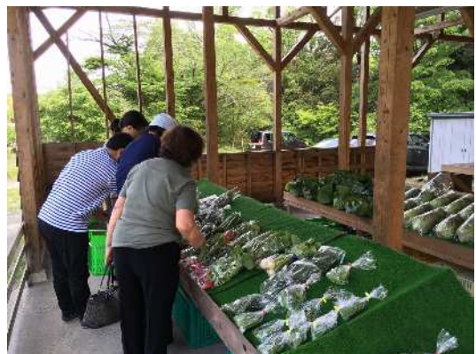
新鮮な地元野菜の直売所