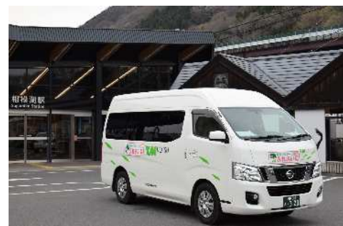
交通不便地域の移動手段である乗合タクシー