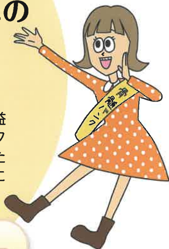
骨髄バンク イメージキャラクター バン子ちゃん

相模原市では、平成31年4月1日から、公益財団法人日本骨髄バンクが実施する骨髄バンク事業において、骨髄・末梢血幹細胞を提供された方及び骨髄ドナーが就業している事業所向けに助成を開始しました。