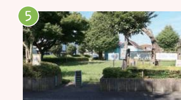
5 青葉小学校なかよし広場 並木4-7-4