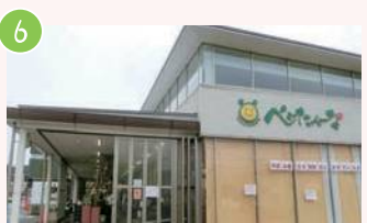
6 ベジタパーナ 青葉3-1-1 JA相模原市が運営する農産物直売所 ショッピングを楽しもう