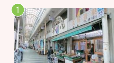
1 西門商店街 相模原6-24-11 歴史あるアーケード商店街 老舗に加えてマニア向けの店舗も