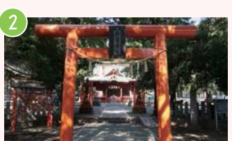
2 村富神社 矢部2-7-15 「村富線」の由来になった神社 春には桜の名所としても話題