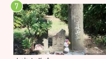
7 当麻山道碑 緑が丘2-40付近 当麻山無量光寺に続く街道の名残 地域住民が大切に管理している