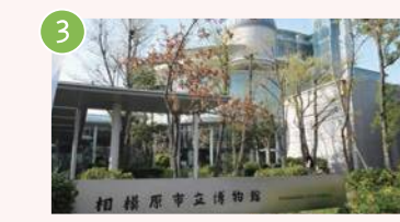
3 市立博物館 高根3-1-15 相模原のことを知るならまずここへ 県内最大級のプラネタリウムも完備