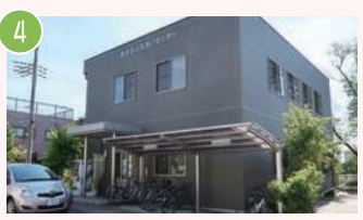
4 光が丘ふれあいセンター 光が丘2-18-87 光が丘地区が誇る人の力の結集