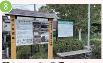
8 陽光台1丁目公園 陽光台1-21付近 旧石器時代の遺跡が出土 横山丘陵付近の歴史を感じよう