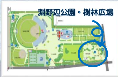
淵野辺公園・樹林広場