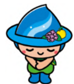
相模原市 マスコットキャラクター 『さがみん』