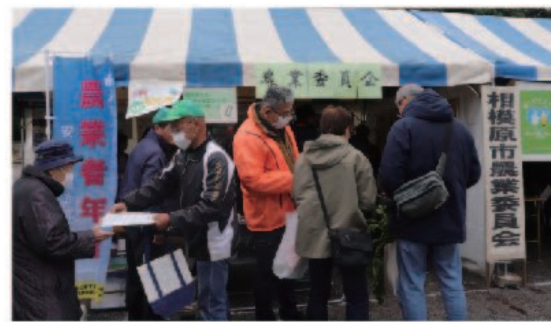
農業まつりでクイズを行っている様子

両日合わせて約340名の方に農業委員会のブースを訪れていただき、クイズに回答した方には、農業委員会オリジナルのエコバッグをプレゼントしました。ご参加いただいた皆様、ありがとうございました。