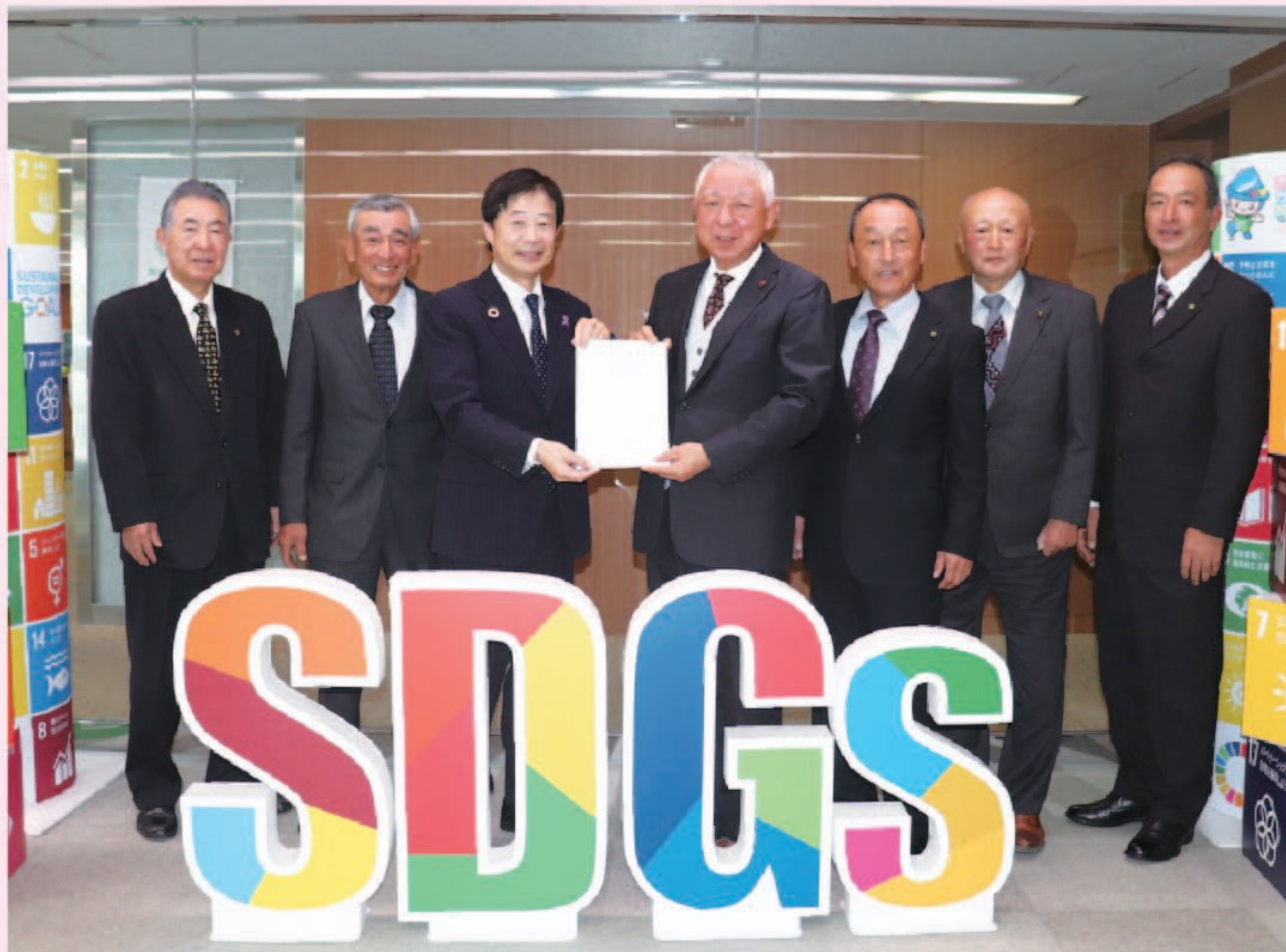
阿部会長(右から4人目)から奈良副市長へ意見書を提出。

こうした取組を通じて、持続した農地の保全とともに、新たな担い手への引継ぎ、相模原市の農業の発展につなげていきます。