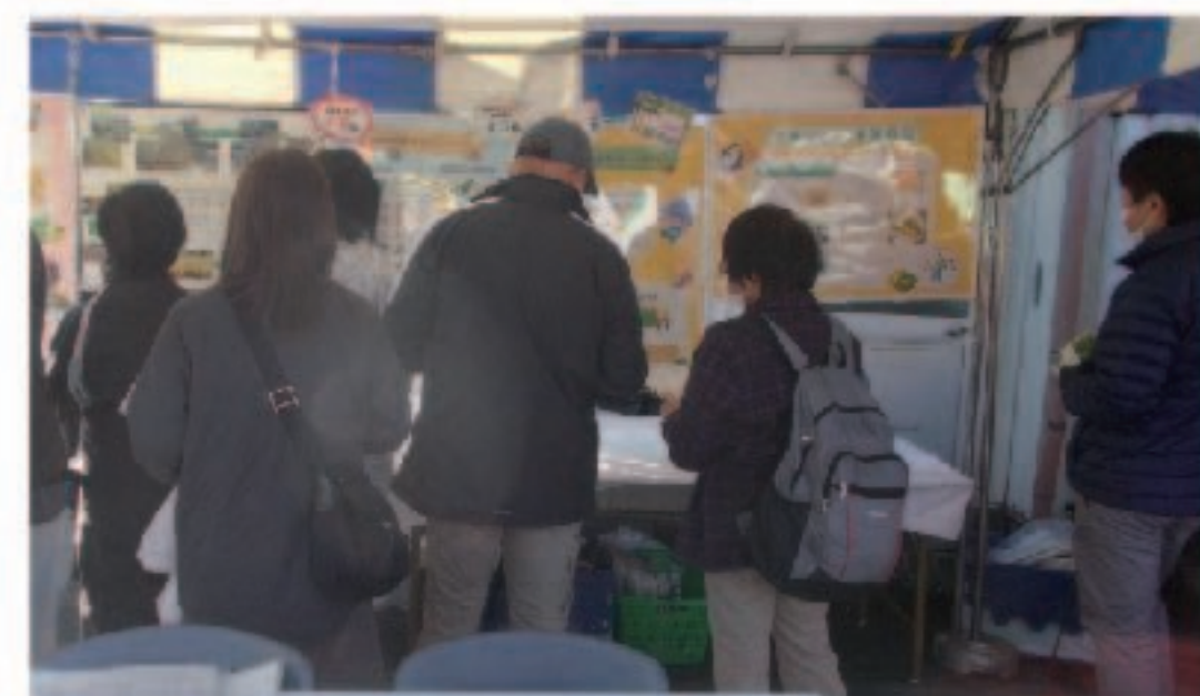
JAまつりのブースの様子

11月12日に開催された「第59回相模原市農業まつり」と、11月18日に開催された「第35回JAまつり」にて、農業委員会の活動や相模原市の農業を知っていただくことを目的に、農業委員会のブースを設置し、パネルの展示と相模原市の農業にまつわるクイズを実施しました。