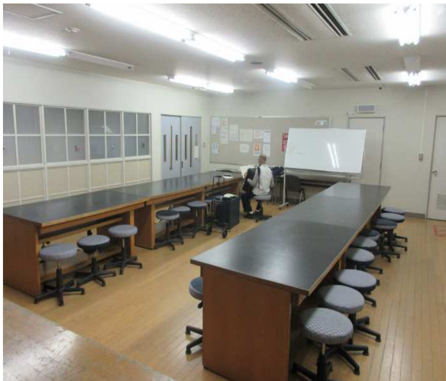
工作室でアコーディオンの練習