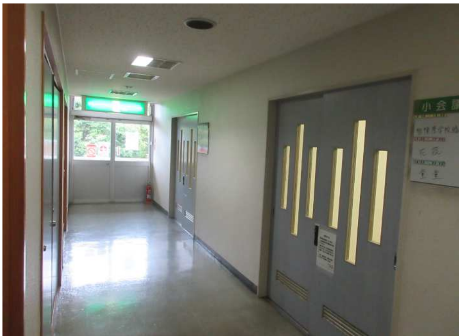
小会議室 1 小会議室 2