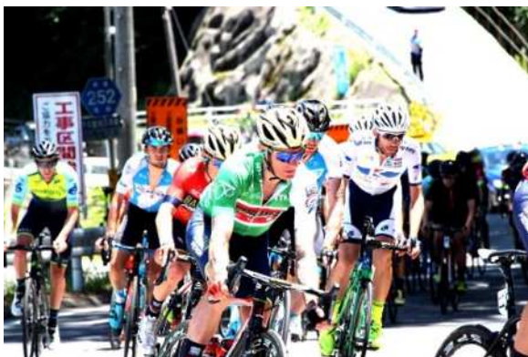
《 参考：南信州ステージの様子 》

本市においては、令和3(2021)年度以降、第7ステージを実施する想定の下、オリンピック自転車ロードレース競技のコースを最大限に活用するコース案にて関係機関と調整しております。