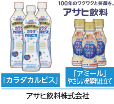
「アミール」 やさしい発酵乳仕立て