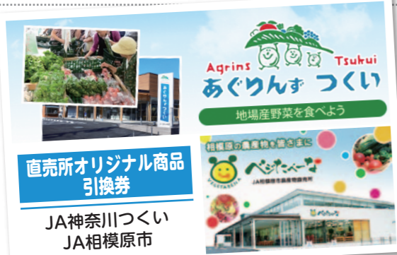
直売所オリジナル商品 引換券