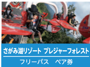
さがみ湖リゾート プレジャーフォレスト フリーパス ペア券