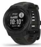
スマートウォッチ