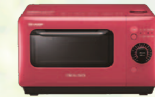
ヘルシオ グリエレンジ