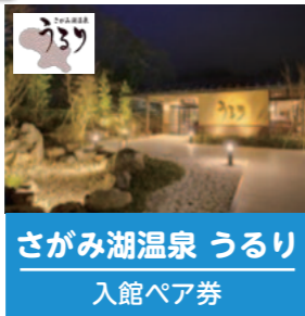
さがみ湖温泉 うるり 入館ペア券