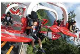
さがみ湖リゾート プレジャーフォレスト フリーパス ペア券