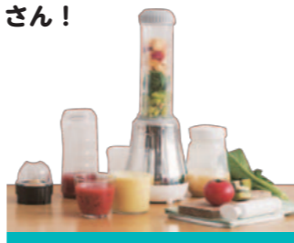
アサヒ軽金属工業 ドクタースムージー スムージーメーカー