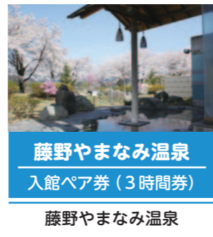
藤野やまなみ温泉 入館ペア券 (3時間券)