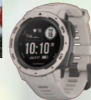
スマートウォッチ