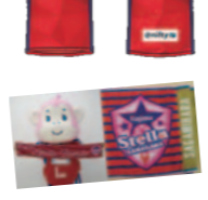
ホームタウンチーム オリジナルグッズ

SC相模原・三菱重工相模原ダイナボアーズ・ノジマ相模原ライズ・ノジマステラ神奈川相模原