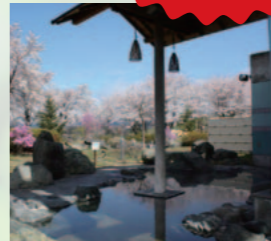
藤野やまなみ温泉 入館ペア券 (3時間券)