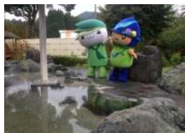
藤野やまなみ温泉 入館ペア券(3時間券)