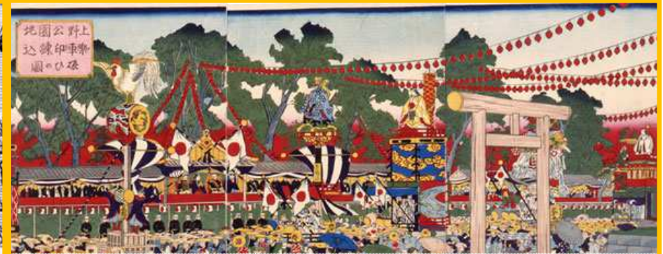
上野恩賜公園（寛永寺跡地） 三代目歌川広重画「上野公園地楽車印練込賑ひの図」