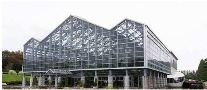
相模原公園グリーンハウス