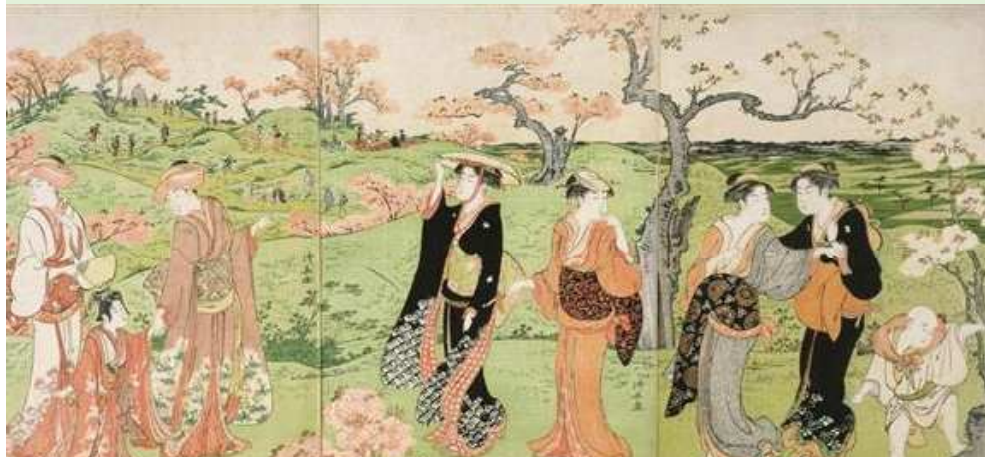
「飛鳥山花見」(18世紀, 鳥居清長)