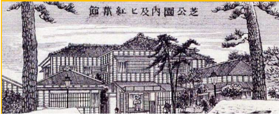
芝公園（増上寺敷地）

太政官布達第十六号 （明治6/1873年，昭和31/1956年都市公園法施行まで適用） 明治政府・太政官より「 群衆遊観の場所 に公園を設ける件」が府県に通達。 意）申し出れば、今まで人が集まっていた場所を公園と指定する。それを 府県が管理しなさい。