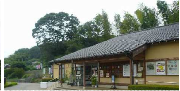
津久井湖城山公園パークセンター