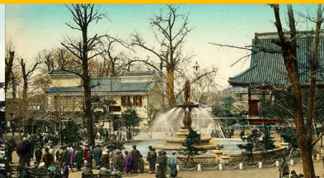
浅草公園（浅草寺敷地）