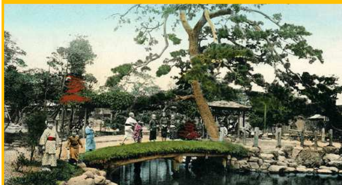
深川公園（永代寺跡地）