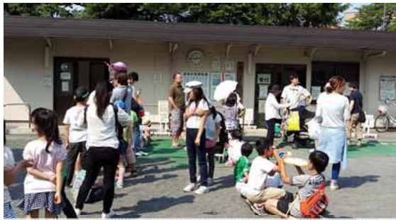
鹿沼公園管理施設

本来、公園は都市環境改善のための緑地確保、災害防止のための施設 →建築物が過剰にあることはあまり好ましくない空間