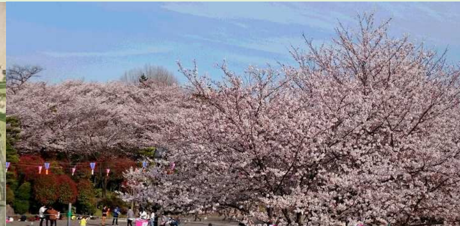
現在の飛鳥山公園