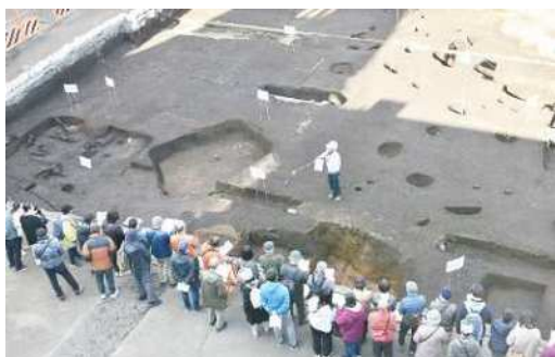
発見した遺構の説明風景