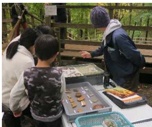
出土品等の説明風景