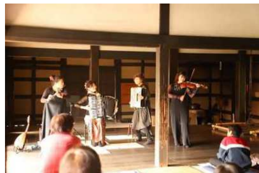
旧青柳寺庫裡×演奏会 お楽しみMusic Box