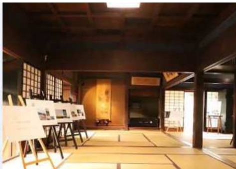
旧中村家住宅×今昔写真展