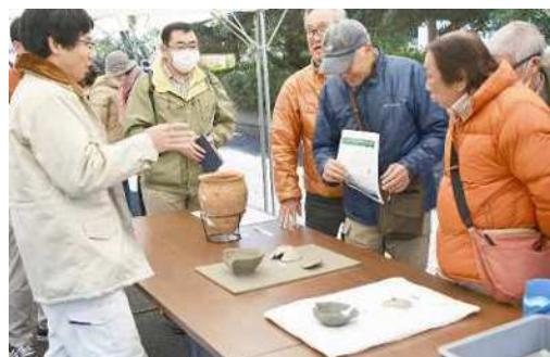
出土品等の説明風景