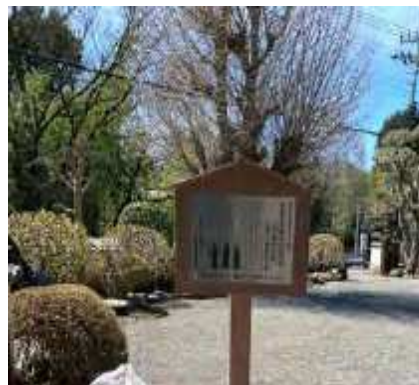
祥泉寺（木造阿弥陀如来立像・木造薬師寺如来立像・木造千手観音菩薩立像 説明板）