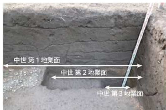
中世造成面（地業面）断面 北東から