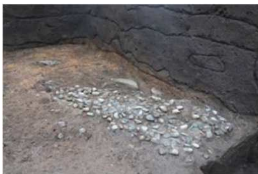
砂利敷き遺構 北東から