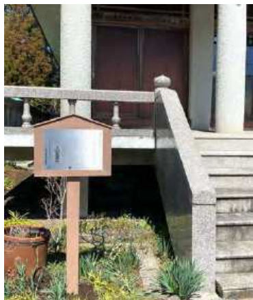
中野友林寺（鉄造聖観音菩薩立像 説明板）

登録史跡千部塚伝承地、緑区広田の下馬梅伝承地では、説明板のプレートの張替えを行い、緑区寸沢嵐の国指定史跡寸沢嵐石器時代遺跡では、説明板の土台の付替えを行いました。