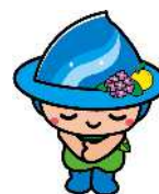
相模原市マスコットキャラクター 「さがみん」