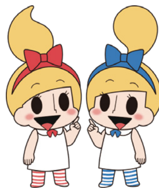
ミビョーナ・ミビョーネ