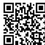
キャンペーンページ