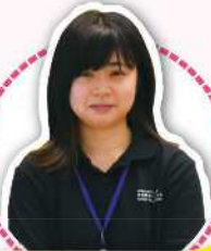
音響スタッフさん