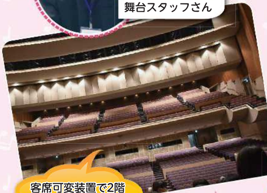
舞台スタッフさん