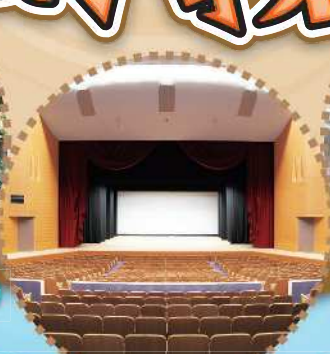
相模女子大学グリーンホール