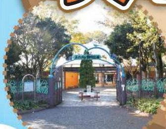
相模原麻溝公園ふれあい動物広場