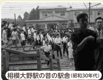
相模大野駅の昔の駅舎(昭和30年代)

戦後、市の人口増加に伴って、相模大野駅周辺は開発され、1996年に今の相模大野駅の姿になりました。