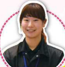
照明スタッフさん