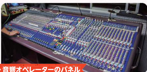
音響オペレーターのパネル

音響スタッフは、劇中に音楽や効果音(BGM)を的確にオペレートするお仕事です。単純に音を入れるのではなく、例えば音源をミックスさせたり、音楽をゆっくり流し入れたり(フェードイン)、ビックリさせる場面で音源を突然止めたりする(カットアウト)など、様々なテクニックを駆使しています。