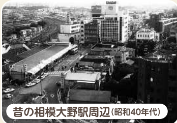
昔の相模大野駅周辺(昭和40年代)