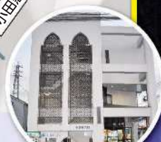
カナコー天文台全景