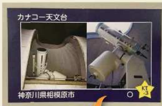
カナコー天文台 の天文台カード