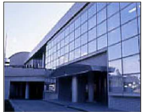
相模原南メディカルセンター