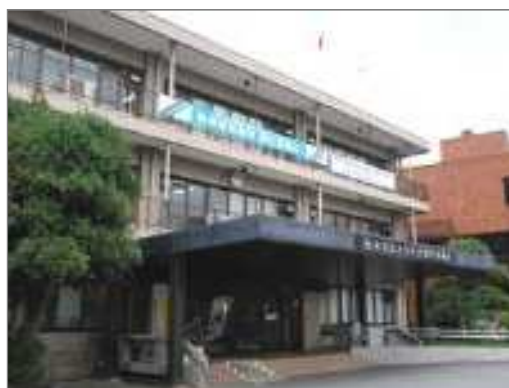
津久井総合事務所