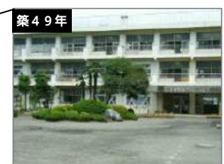
中野小学校 建築年度：S47-H23 延床面積：6,813㎡