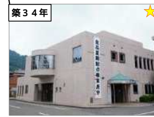
津久井保健センター 建築年度：S62 延床面積：941㎡