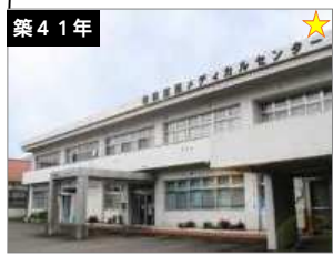
相模原西メディカルセンター 急病診療所 建築年度：S55 延床面積：544㎡