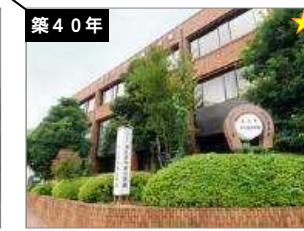
津久井中央公民館・ 津久井老人福祉センター 建築年度：S55 延床面積：2,557㎡