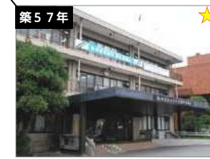
津久井総合事務所 建築年度：S39-H18 延床面積：2,334㎡