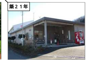
津久井地域福祉センター 建築年度：H12 延床面積：236㎡

建設年度は令和2年4月1日時点。築年数は、白字が築40年以上、黒字は築40年未満