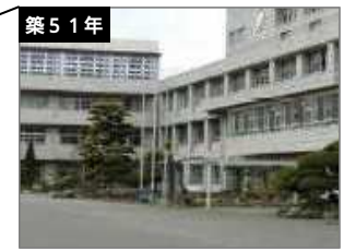
中野中学校 建築年度：S45-S63 延床面積：7,784㎡