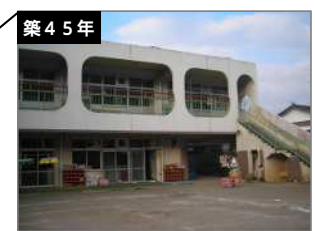
中野保育園 建築年度：S51 延床面積：857㎡