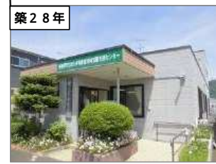
津久井障害者地域活動 支援センター 建築年度：H5 延床面積：230㎡