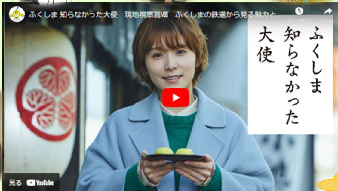
現地視察篇Ⅷ ふくしまの鉄道から見る魅力と伝統