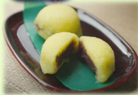
奥会津柳津 あわまんじゅう