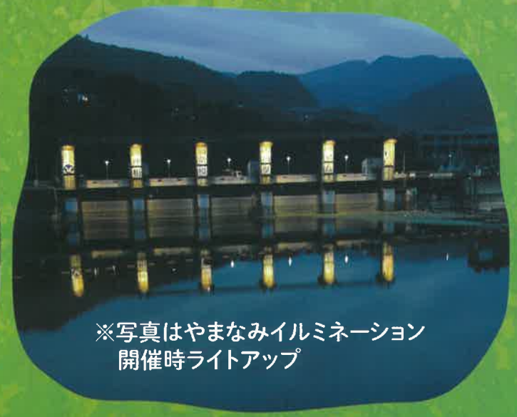
※写真はやまなみイルミネーション 開催時ライトアップ