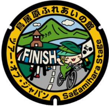
鳥居原ふれあいの館