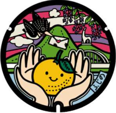
藤野やまなみ温泉