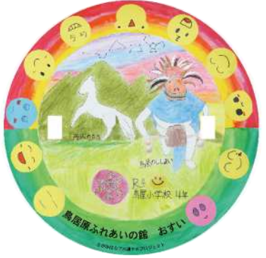
鳥居原ふれあいの館 (鳥屋小学校4年生デザイン)