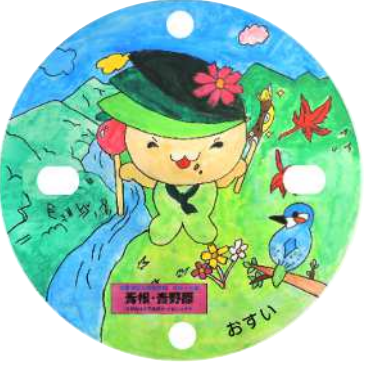
青和学園 (青和学園4年生デザイン)