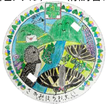
藤野やまなみ温泉(牧野連絡所) (藤野南小学校4年生デザイン)

◆中山間地域の活性化及び下水道事業の普及啓発を目的に、東京2020オリンピック自転車競技と、そのレガシーとして開催しているツアー・オブ・ジャパン相模原ステージや地域の魅力的な資源等を活かし、地元にご教えていただいた“魅力”“誇り”を詰め込んだデザインとしました。