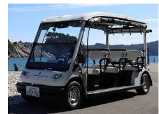
実証運行使用車両 ヤマハ発動機社製 AR-07