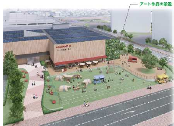
複合施設整備イメージ図 (※今後の詳細検討により変更の可能性有)