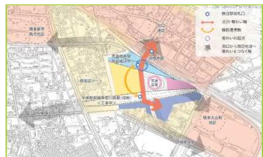
▲まちづくりの骨格図

さらに、駅、交通広場等の交通結節機能と周辺街区を一体的に捉え、相互に調整を図りながら空間整備及び機能配置を行い、駅まち一体のまちづくりを促進します。