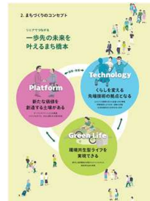
▲まちづくりのコンセプトと3つのテーマ