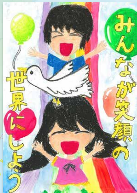
「みんなが笑顔の世界にしよう」