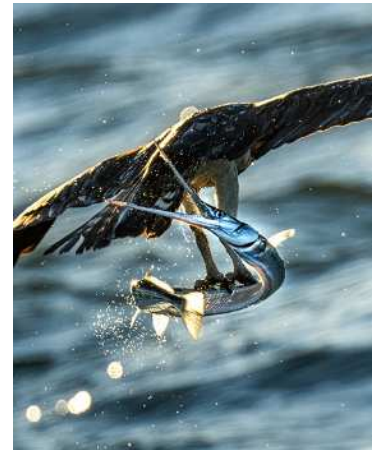
わお！グランプリ作品 「ダツの反撃」