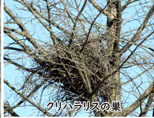
クリハラリスの巣