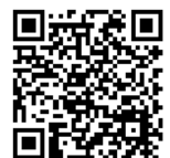
わお！わお！生物多様性 プロジェクトHP