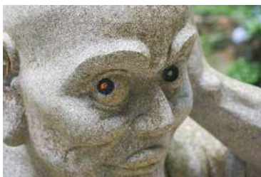
わお！博士賞「カラコンに挑戦」