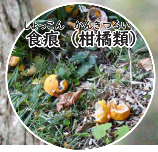
しほっこん かんざつるい 食痕 (柑橘類)